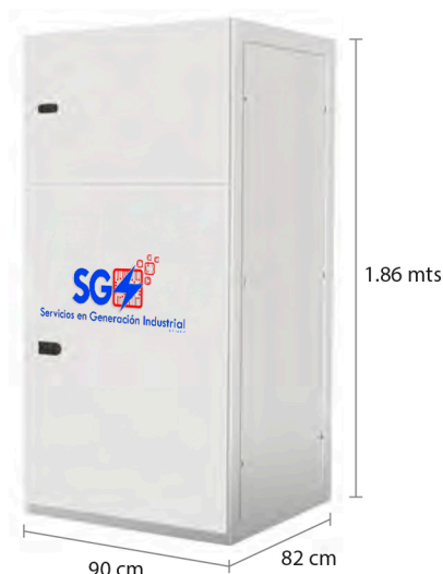
TABLERO DE CONTROL Y TRANSFERENCIA MCA GP SIEGO A PIE DE GENERADOR MODELO GP- C TIPO NEMA1

El tablero de transferencia automático (alojado en gabinete ciego tipo NEMA1) modelo GP-100 (220V) formado por contactores magnéticos de 350 Amp. tiene la función de hacer la transferencia y retransferencia de la carga de la red de CFE a la planta y viceversa, todo esto de forma automática o manual.