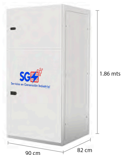
TABLERO DE CONTROL Y TRANSFERENCIA MCA GP CIEGO A PIE DE GENERADOR MODELO GP- C TIPO NEMA1

Los tableros de transferencia automáticos (alojado en gabinete ciego tipo NEMA1) modelo GP-150 (220V) con una transferencia de doble tiro de 500 Amp. tiene la función de hacer la transferencia y retransferencia de la carga de la red de CFE a la planta y viceversa, todo esto de forma automática o manual.